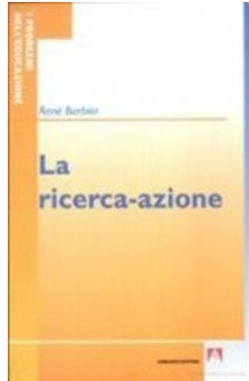
René Barbier, Armando Editore, 2007