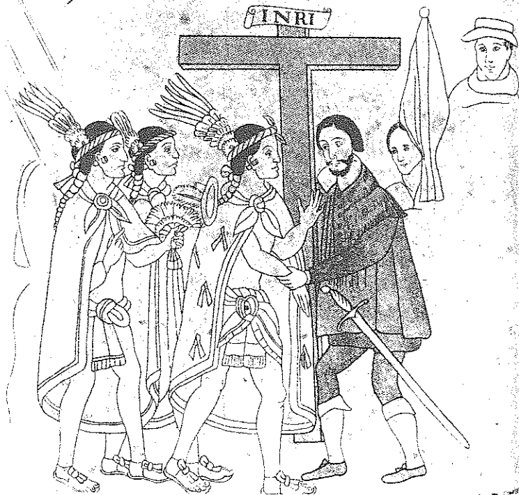
Lámina 5. a del Lienzo de Tlaxcala.